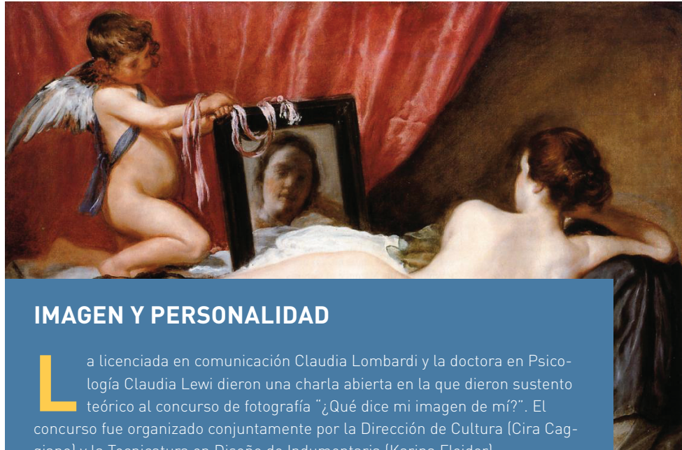
IMAGEN Y PERSONALIDAD