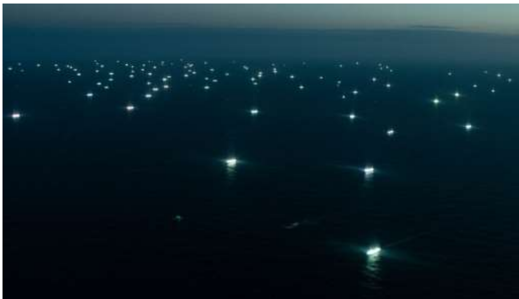
Anexo 3: puntos de transbordos sospechosos. OCEANA, ver en https://oceana.org/press-center/press-releases/oceana-report-exposes-thousands-suspected-vessel-rendezvous-sea