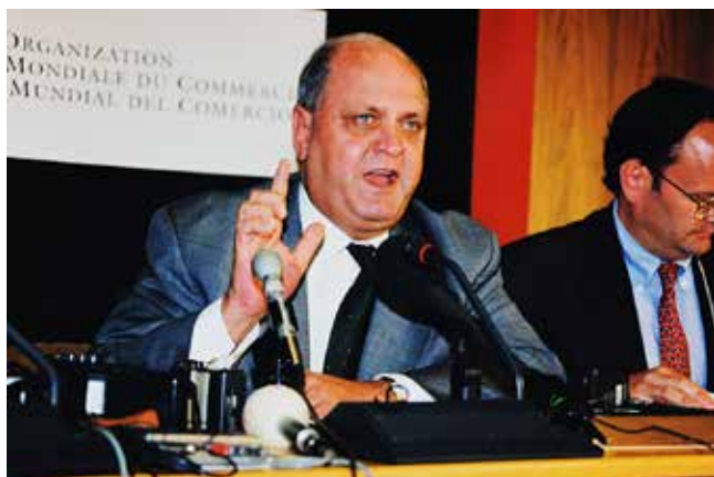
Director General Mike Moore

17 de Septiembre de 2001 - Siguiendo la línea de acercamiento al plano internacional que ha demostrado la República Popular de China desde los años 80, hoy el enorme país en desarrollo completó formalmente las negociaciones para su adhesión en la Organización Mundial del Comercio (OMC). Este proceso de adhesión se viene trabajando dentro de la OMC desde mitades de la década de los 80, y ya en julio el Director General Mike Moore había expresado su satisfacción por los sustanciales avances logrados por los Gobiernos de los países Miembros de la OMC en su intento de completar los trabajos relativos a la adhesión de China a la Organización. El día 17 de Septiembre las negociaciones finales fueron aceptadas por ambas partes, bajo la presidencia del Embajador Pierre-Louis Girard, de Suiza, el Grupo de Trabajo encargado de formular los textos necesarios para la adhesión, concluyó casi 15 años de negociaciones con China y acordó presentar unas 900 páginas de textos jurídicos para su aceptación formal por los 142 gobiernos Miembros de la OMC.