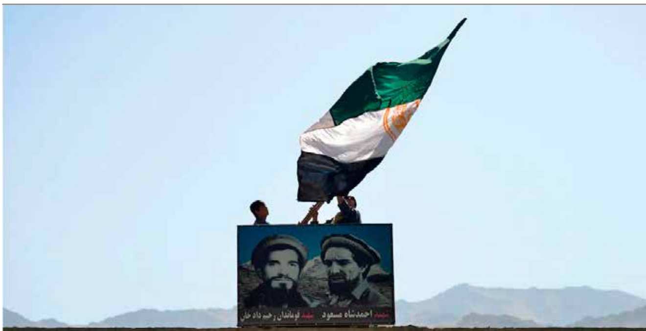
Vista del valle de Panjshir desde la tumba de Ahmad Shah Massoud en el décimo aniversario de su asesinato. https://www.abc.net.au/news/2021-09-07/panjshir-valley-last-province-fall-to-taliban-ahmad-massoud/100412394