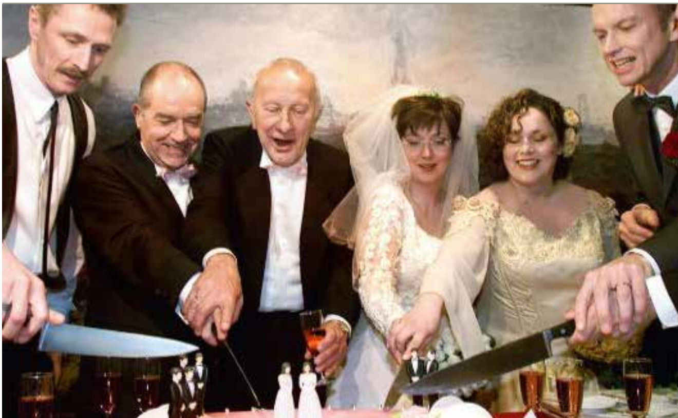
El día anterior al 1ero de abril, cuatro parejas se convirtieron en los primeros matrimonios homosexuales occidentales, siendo tres parejas gays y una pareja lesbiana en los Países Bajos