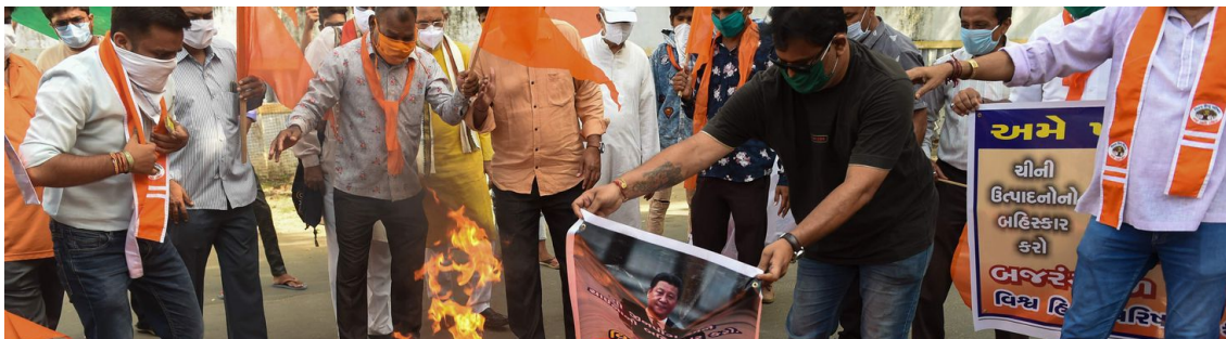
Partidarios de un grupo de extrema derecha hindú queman carteles del presidente chino, Xi Jinping, durante una manifestación en la ciudad india de Ahmedabad

Kosovo's President Thaci, nine others indicted for war crimes