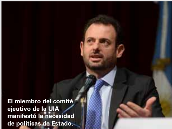
El miembro del comité ejecutivo de la UIA manifestó la necesidad de políticas de Estado.